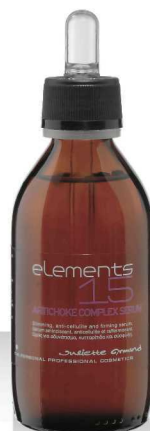
15 ARTICHOKE COMPLEX SERUM 120мл