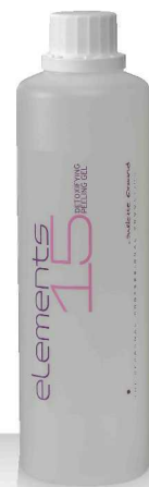
15 DETOXIFYING PEELING GEL 520мл