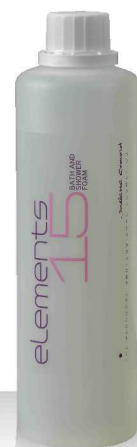
15 BATH AND SHOWER FOAM 520мл