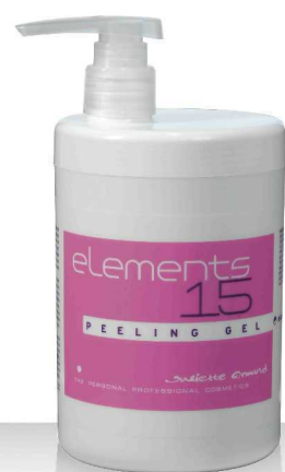
15 PEELING GEL 1000мл