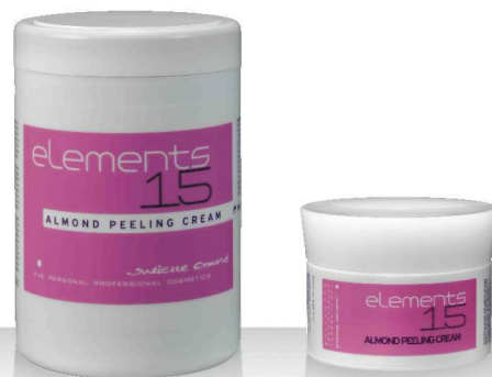
15 ALMOND PEELING CREAM 1000мл / 200мл