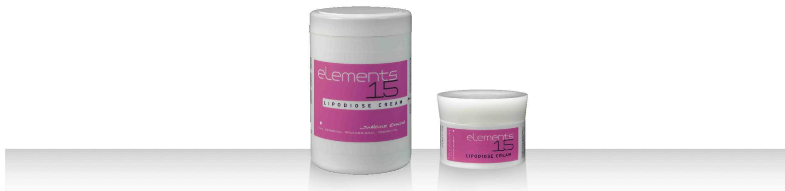
15 LIPODIOSE CREAM 1000мл / 200мл