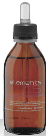
15 10% CAFFEINE & ARTICHOKE SERUM 120мл