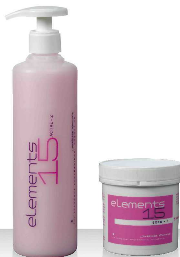
15 EXFO-1 280мл, ACTIVE-2 520мл