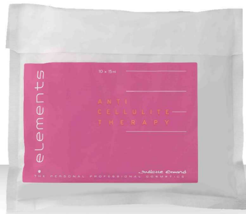
15 ANTI CELLULITE THERAPY 10*15мл