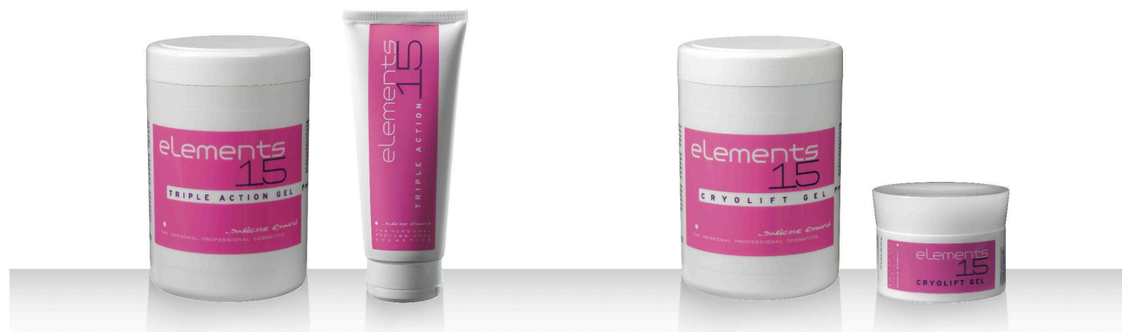
15 TRIPLE ACTION GEL 1000мл / 200мл