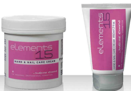
15 HAND AND NAIL CARE CREAM 280мл / 50мл