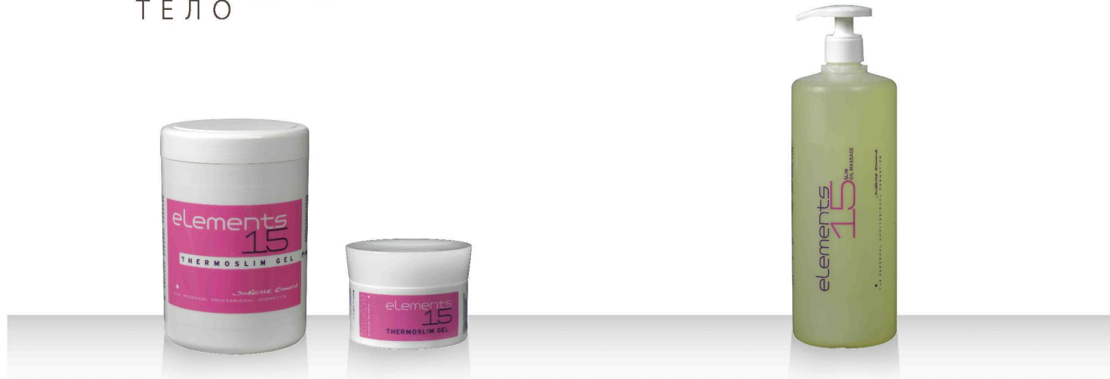
15 THERMOSLIM GEL 1000мл / 200мл