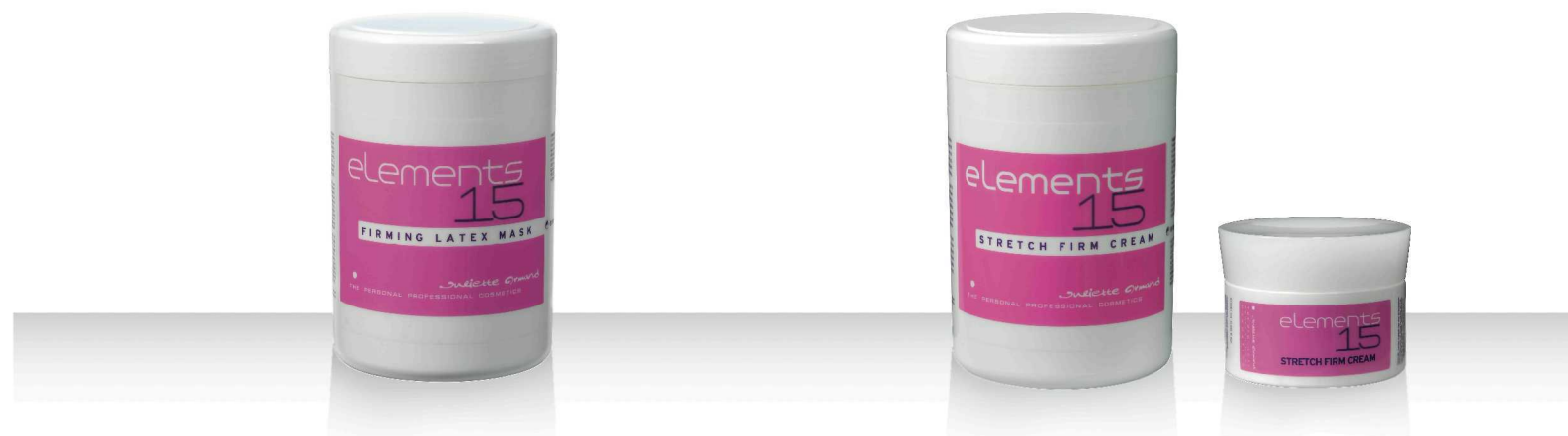
15 FIRMING LATEX MASK 1кг.