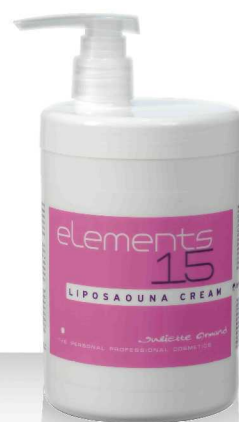
15 LIPOSAOUNA CREAM 1000мл