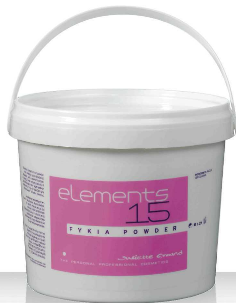
15 FYKIA POWDER 1,2кг.