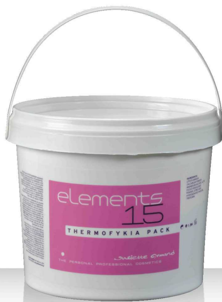
15 THERMOFYKIA PASK 1,5кг.