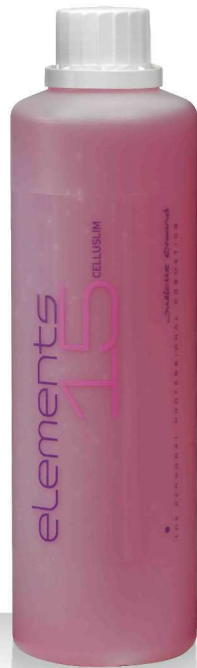
15 CELLUSLIM SERUM 520мл