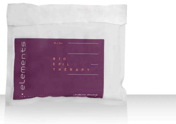
BIO EPIL 10*15мл