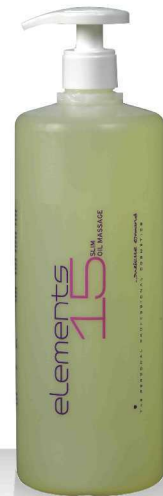
15 SLIM OIL MASSAGE 1000мл