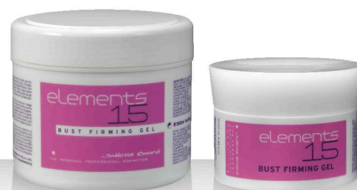
15 BUST FIRMING GEL 500мл / 200мл