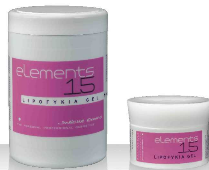
15 LIPOFYKIA GEL 1000мл / 200мл