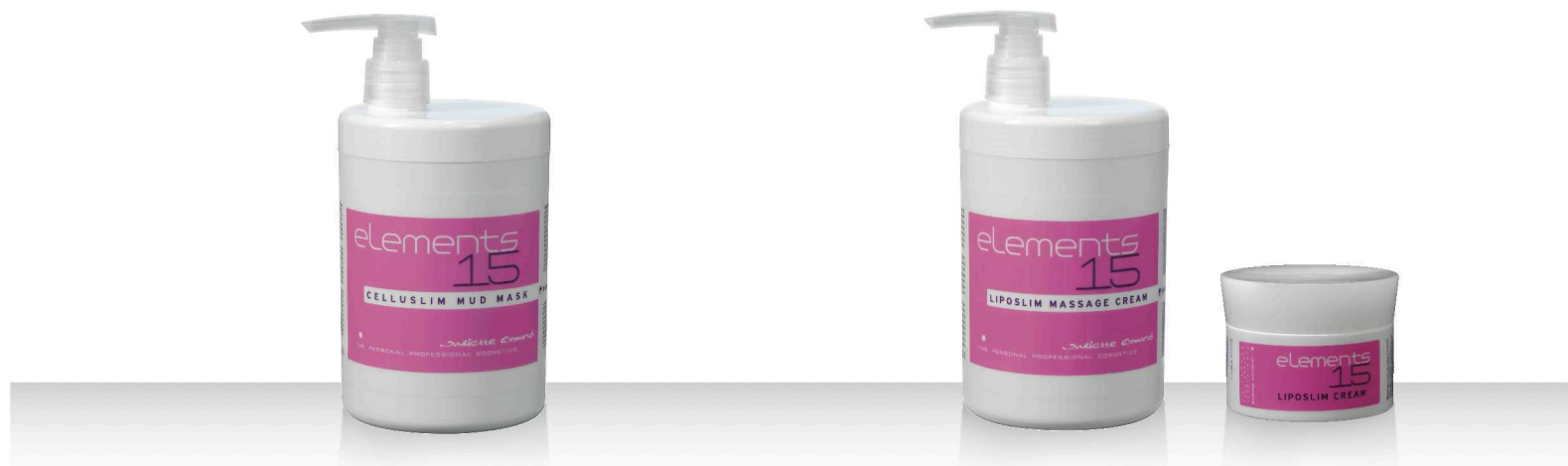
15 CELLUSLIM MUD MASK 1000мл