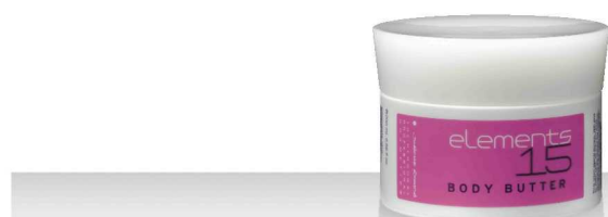
15 BODY BUTTER 200мл