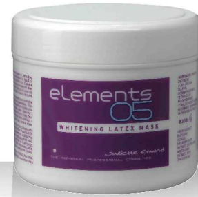
05 WHITENING LATEX MASK 200гр