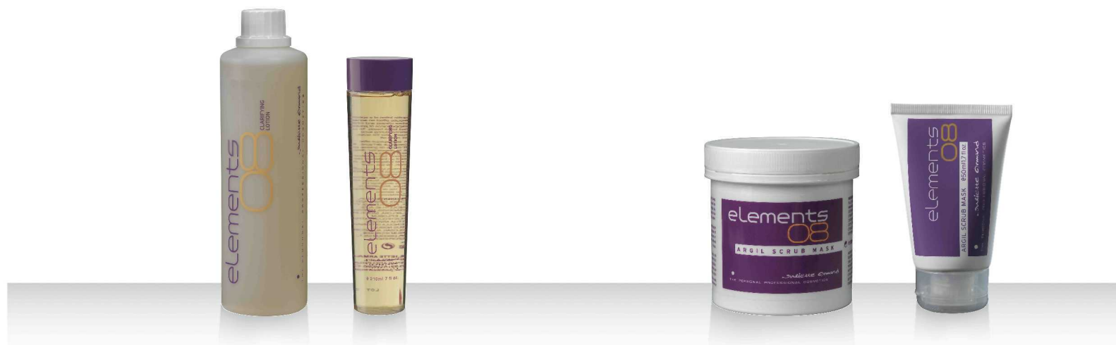
08 CLARIFYING LOTION 520мл / 210мл