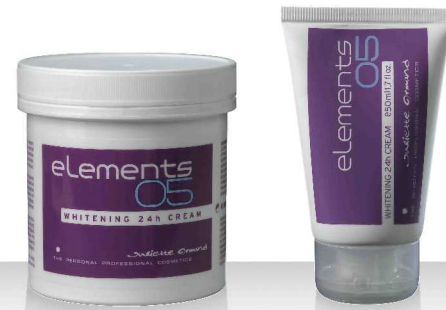
05 WHITENING 24h CREAM 280мл / 50мл