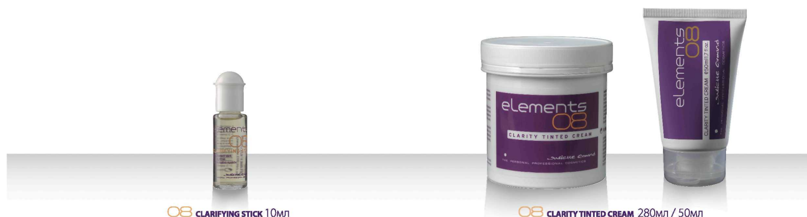
08 CLARIFYING STICK 10мл