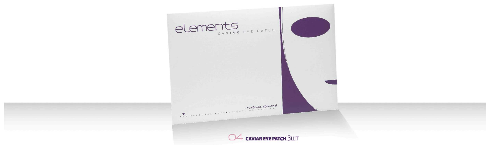
04 CAVIAR EYE PATCH 3шт