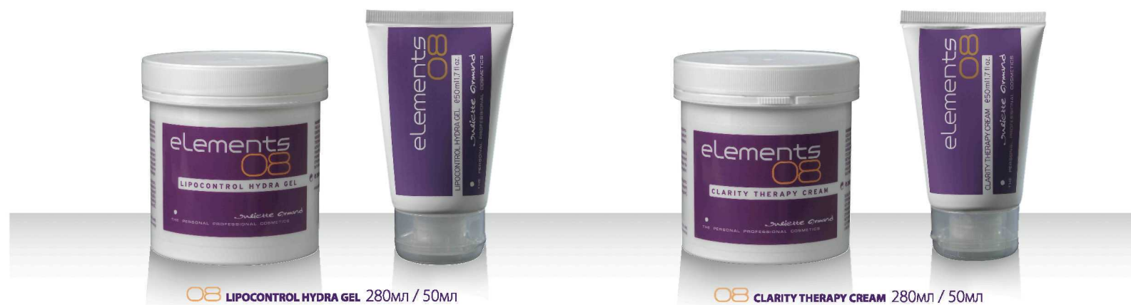
08 LIPOCONTROL HYDRA GEL 280мл / 50мл