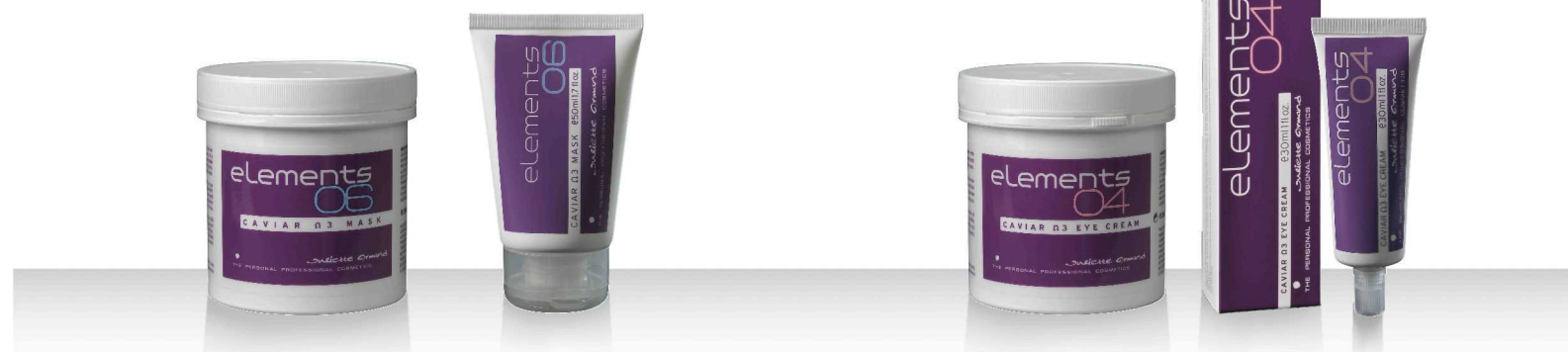
06 CAVIAR Ω3 MASK 280мл / 50мл