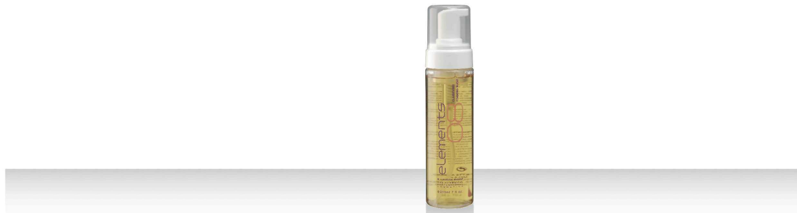
08 CLARIFYING FOAMING WASH 210мл