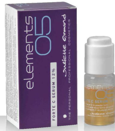
05 FORTE C 12% 10мл