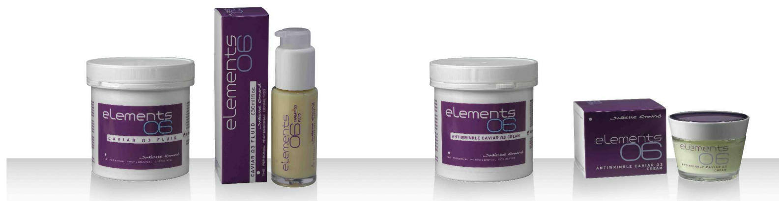
06 CAVIAR Ω3 FLUID 280мл / 150мл / 30мл