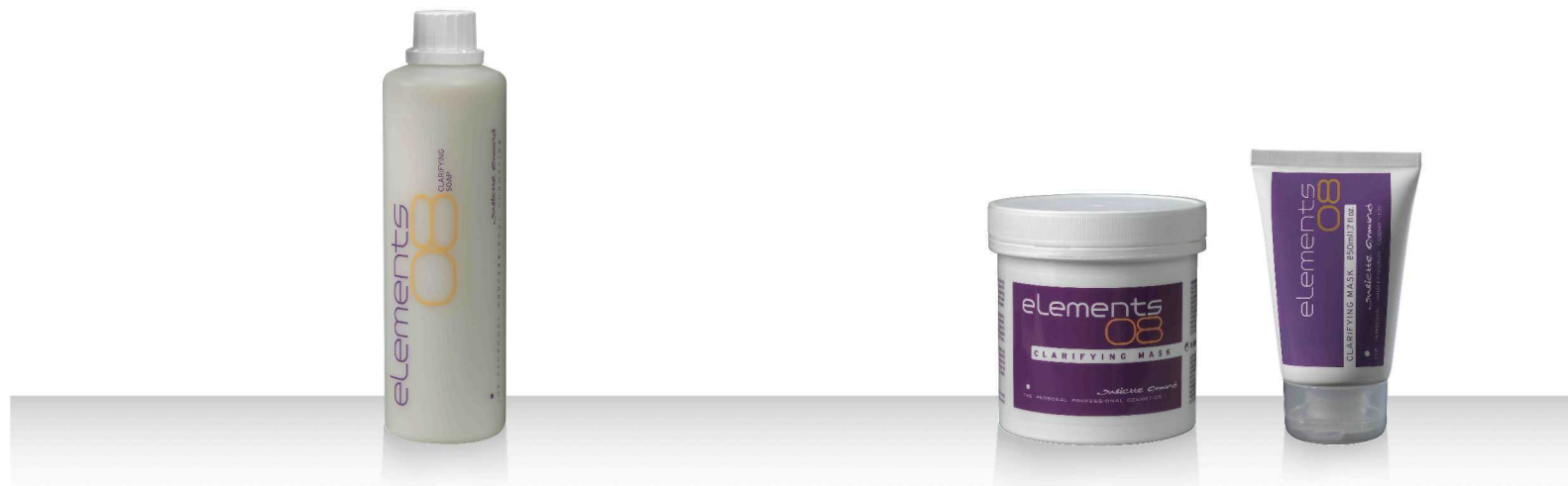
08 CLARIFYING SOAP 520мл