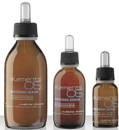
05 WHITENING SERUM 120мл / 55мл / 20мл