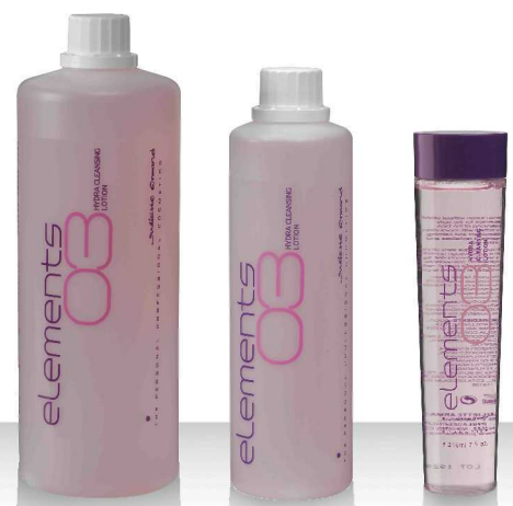
03 HYDRA CLEANSING LOTION 1000мл / 520мл / 210мл