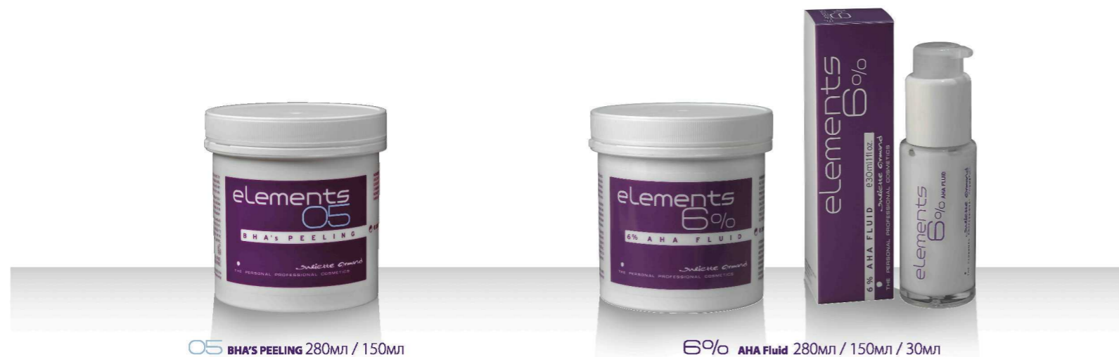
05 BHA'S PEELING 280мл / 150мл