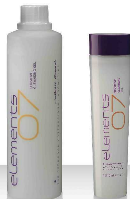
07 SENSITIVE CLEANSING GEL 520мл / 210мл