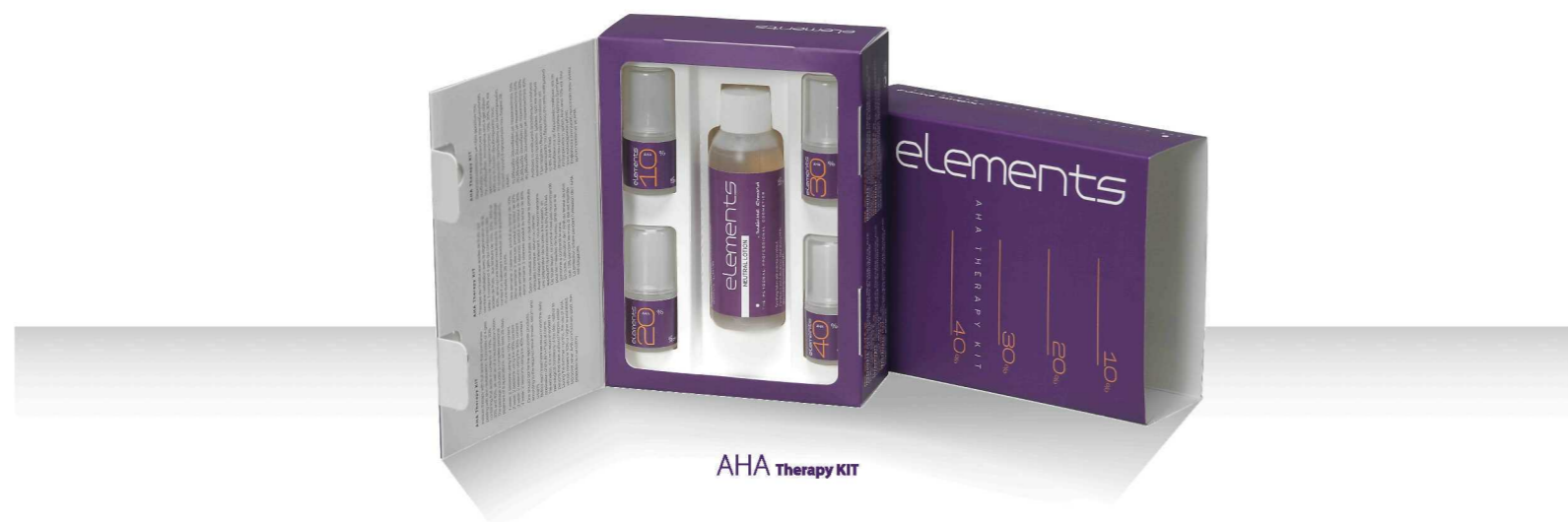
ANA Therapy KIT