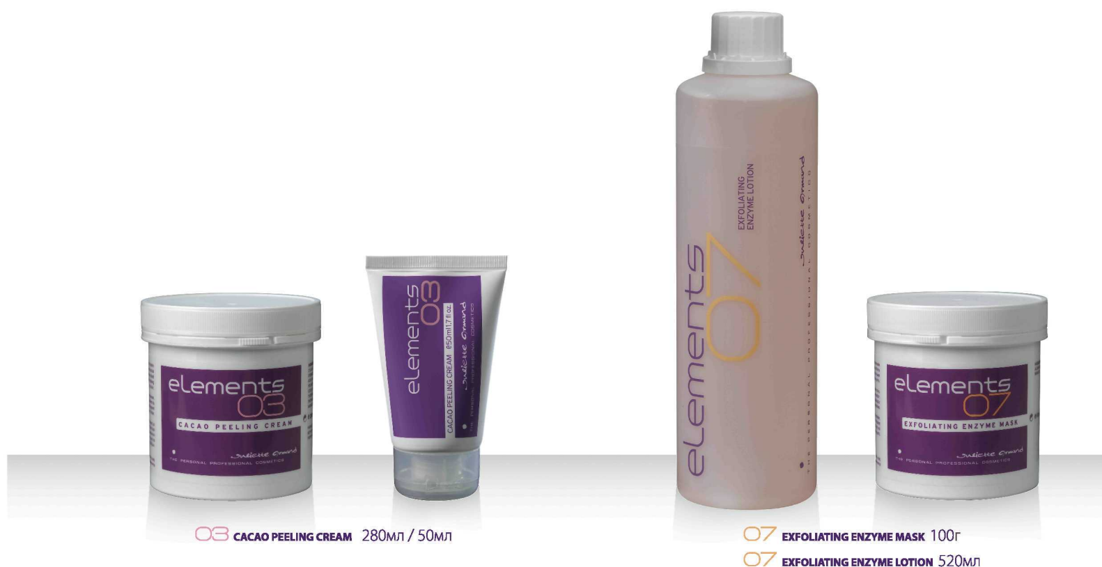
03 CACAO PEELING CREAM 280мл / 50мл