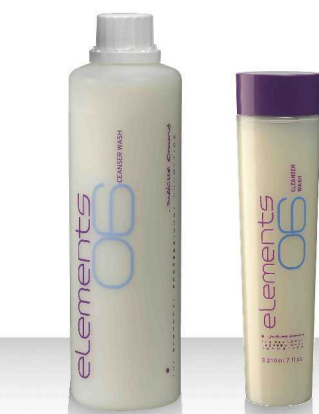
06 CLEANSER WASH 520мл / 210мл