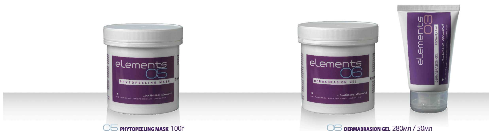
05 PHYTOPEELING MASK 100г