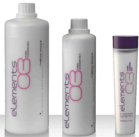
03 HYDRA CLEANSING MILK 1000мл / 520мл / 210мл