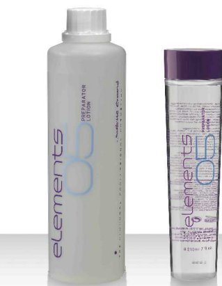
05 PREPARATOR LOTION 520мл / 210мл